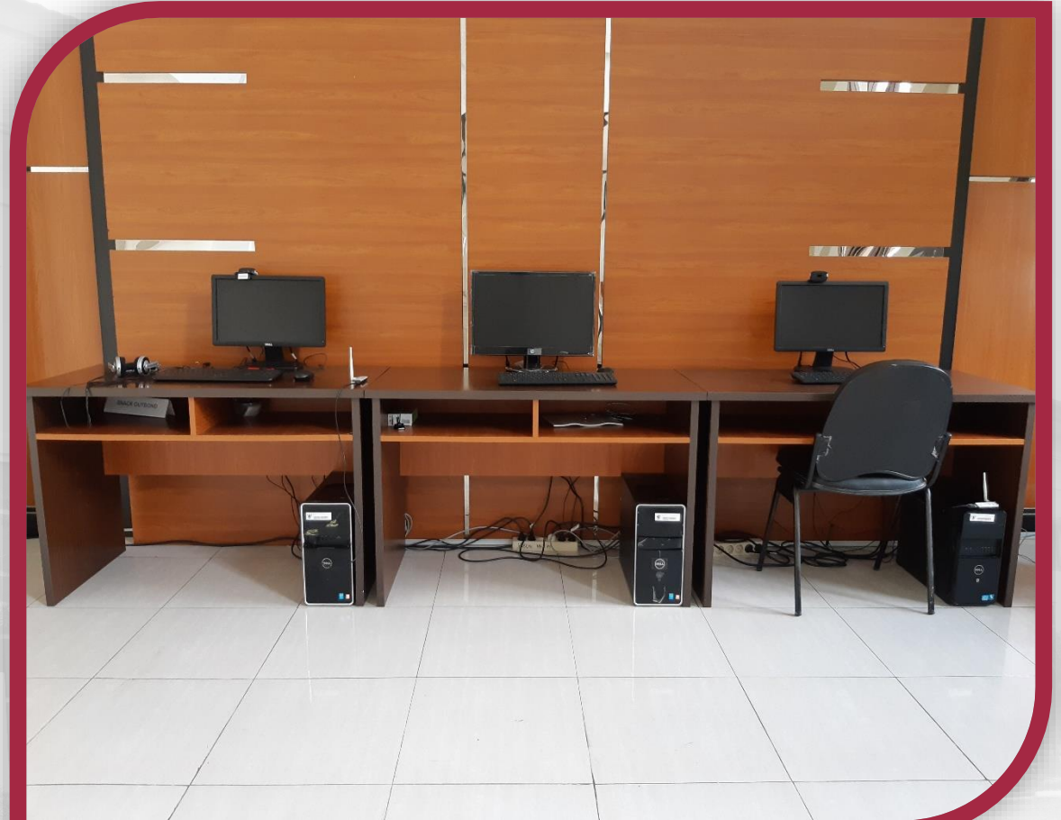
Pojok Digital di Grha Konstitusi 2