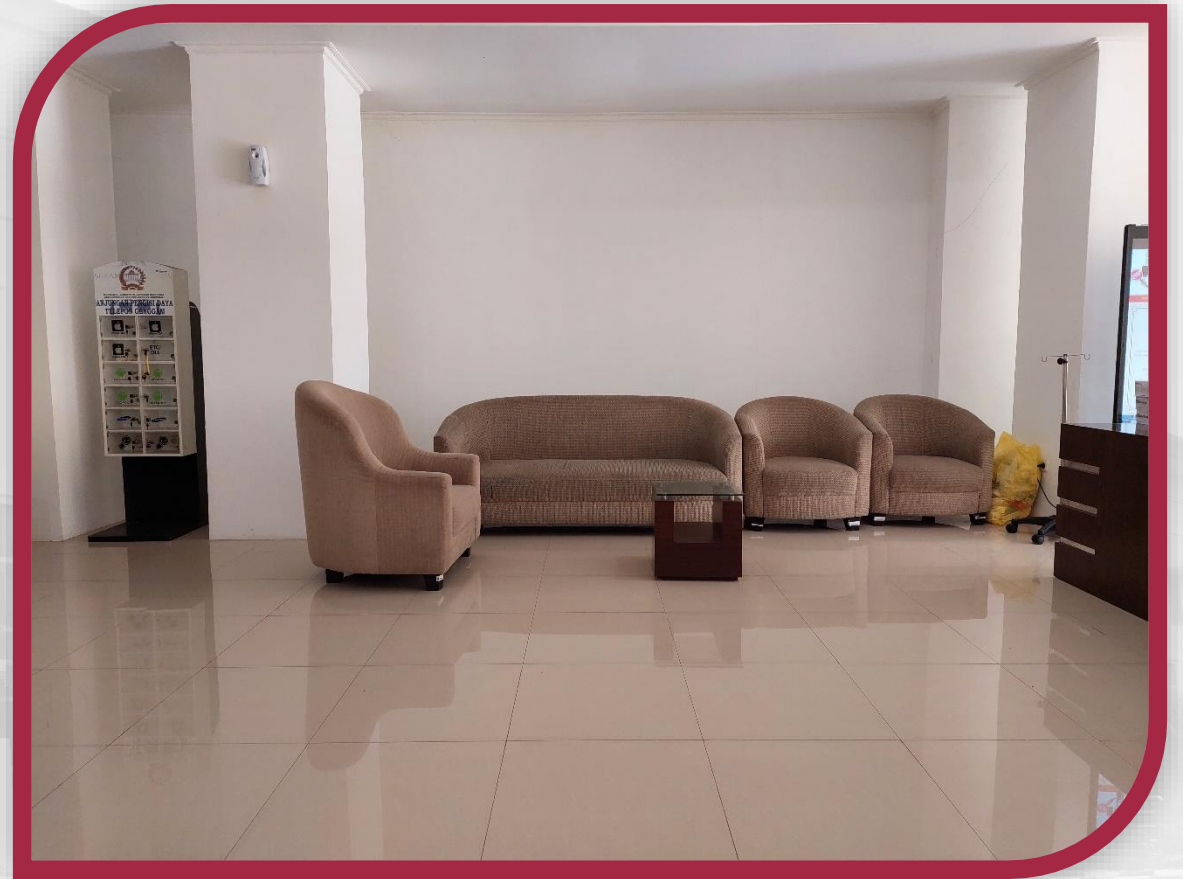
Ruang Registrasi dan Ruang Tunggu Peserta di Grha Konstitusi 2