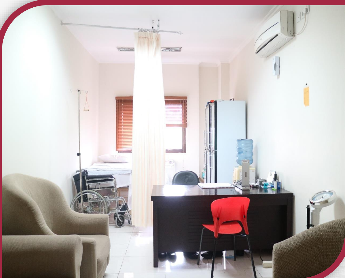
Poliklinik di Grha Konstitusi 2