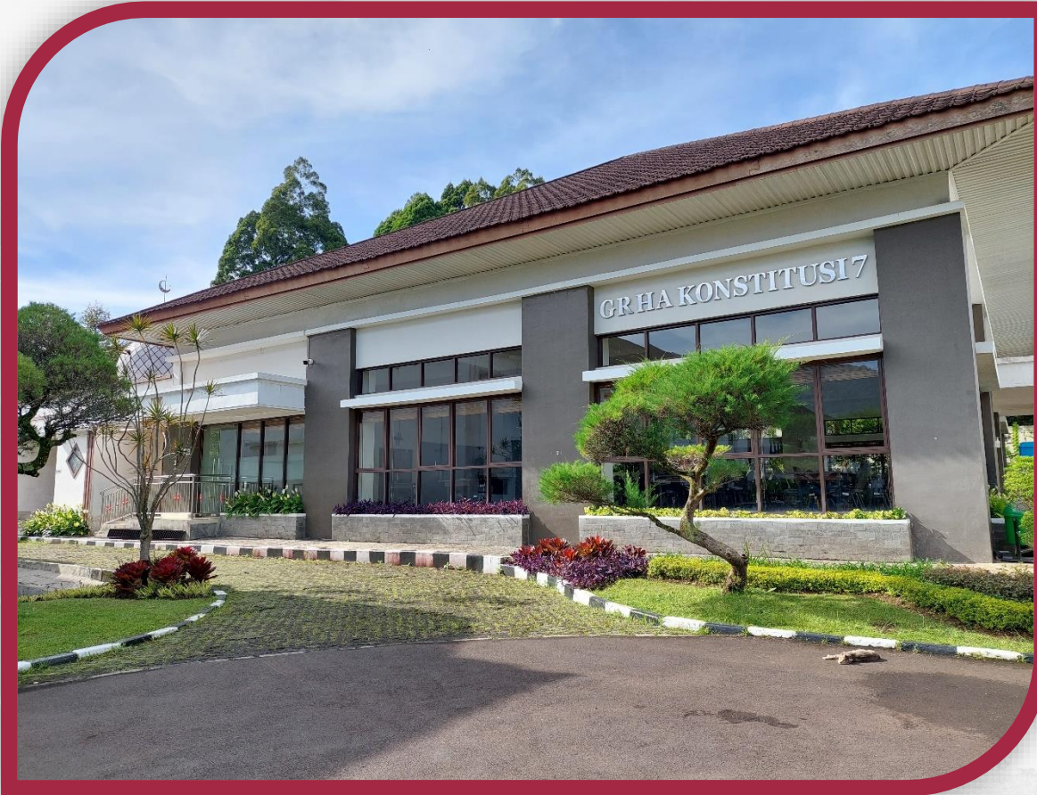
Tempat Makan Peserta