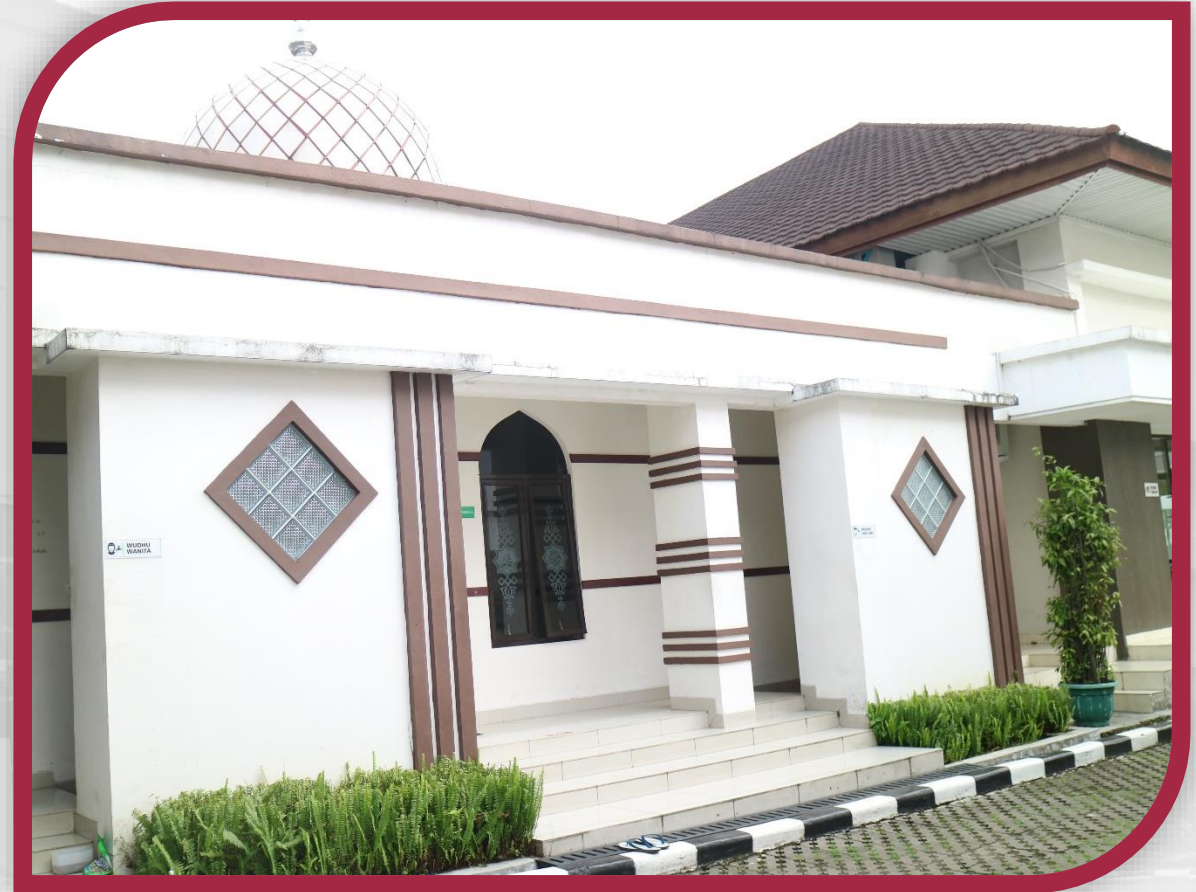
Di Samping Grha Konstitusi 7