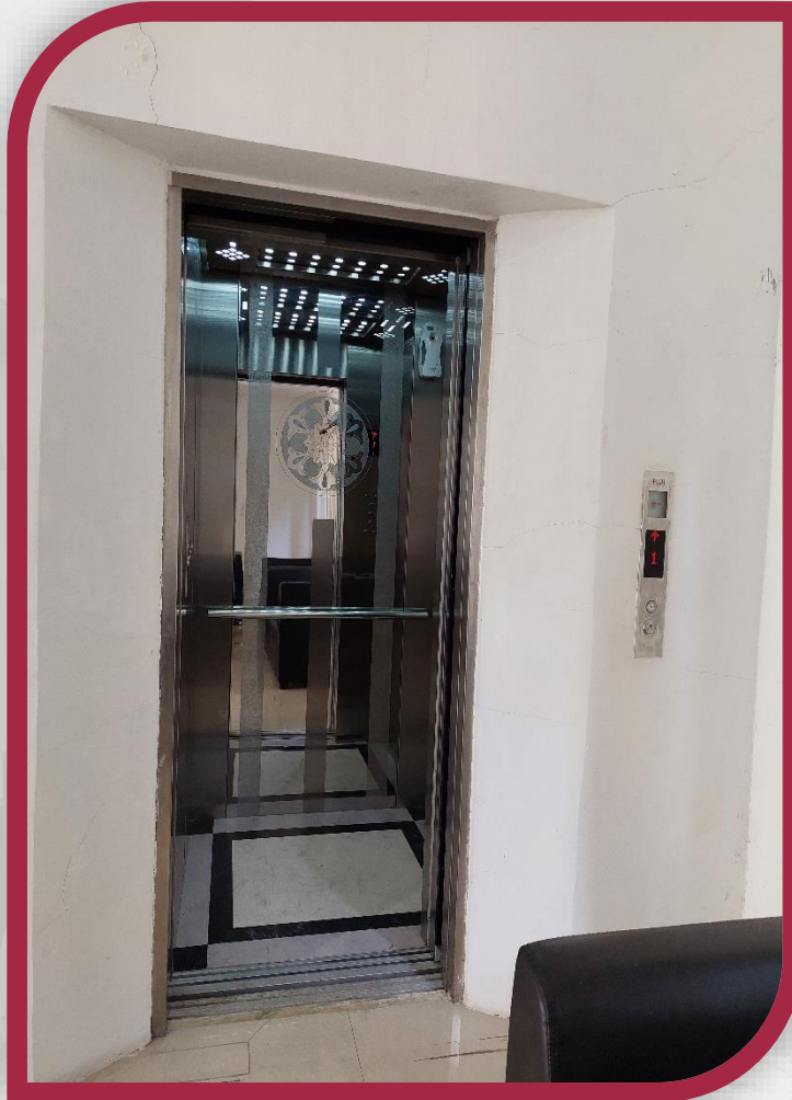
Lift di Lobby Grha Konstitusi 2