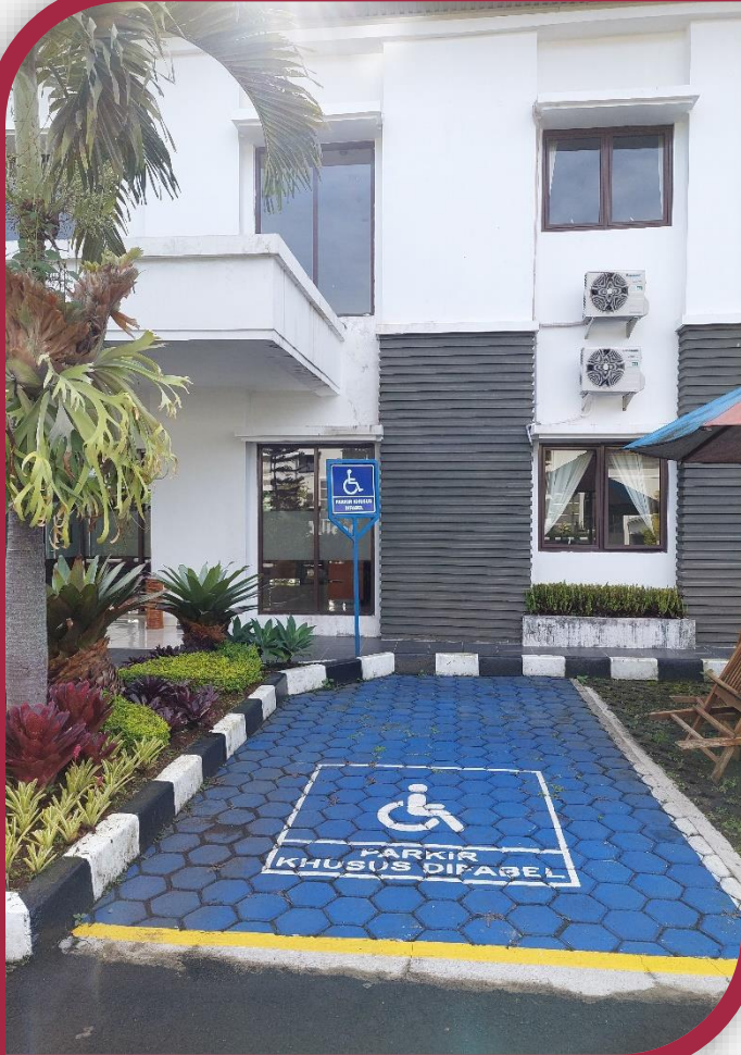
Parkir Khusus Disabilitas di Depan Grha Konstitusi 4