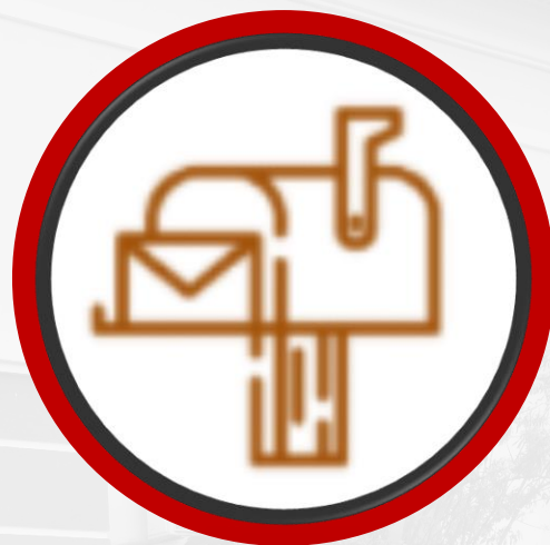
Masukan dan Saran di Microsite pusdik.mkri.id