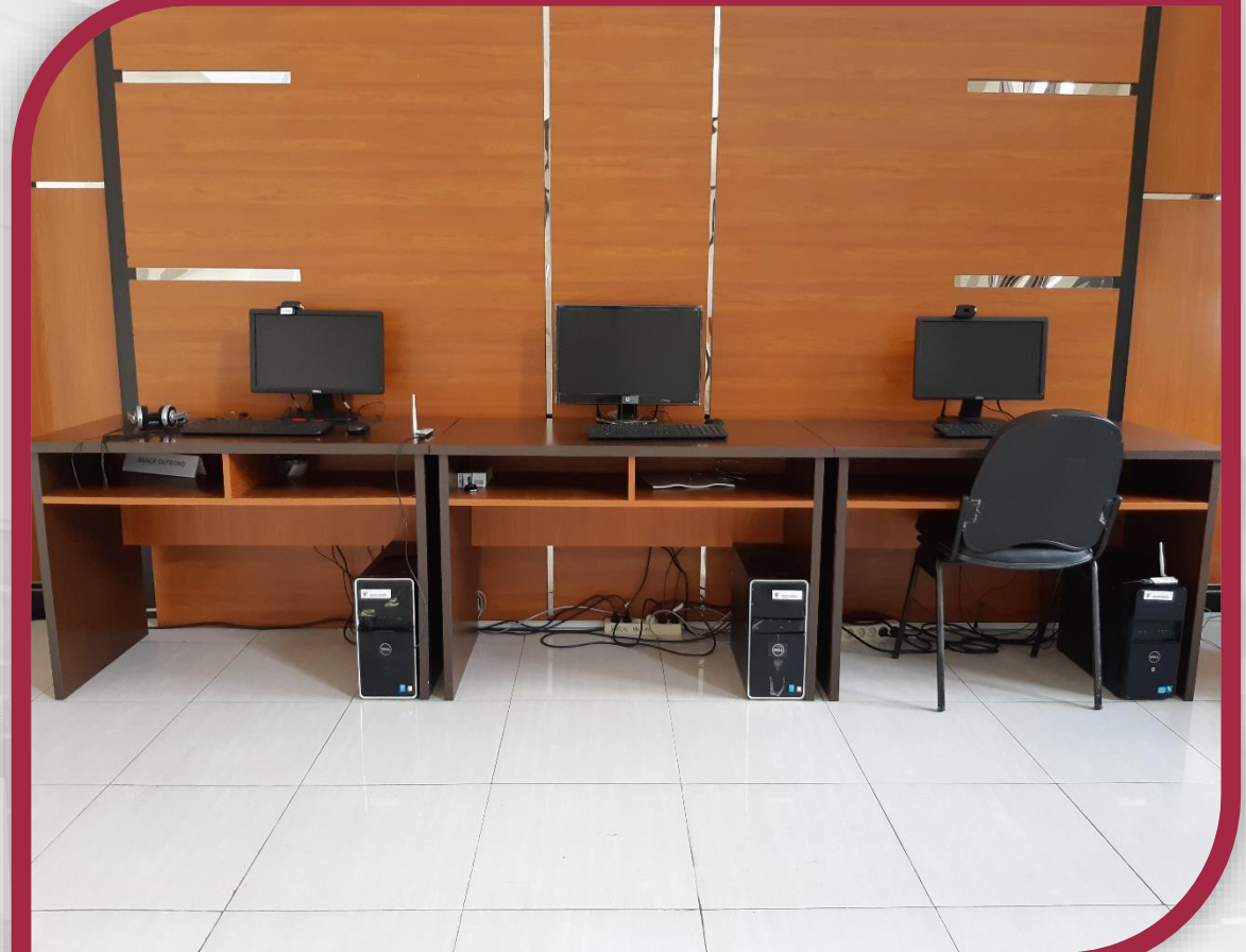
Pojok Digital di Grha Konstitusi 2