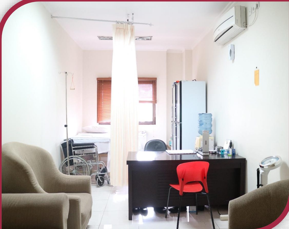
Poliklinik di Grha Konstitusi 2