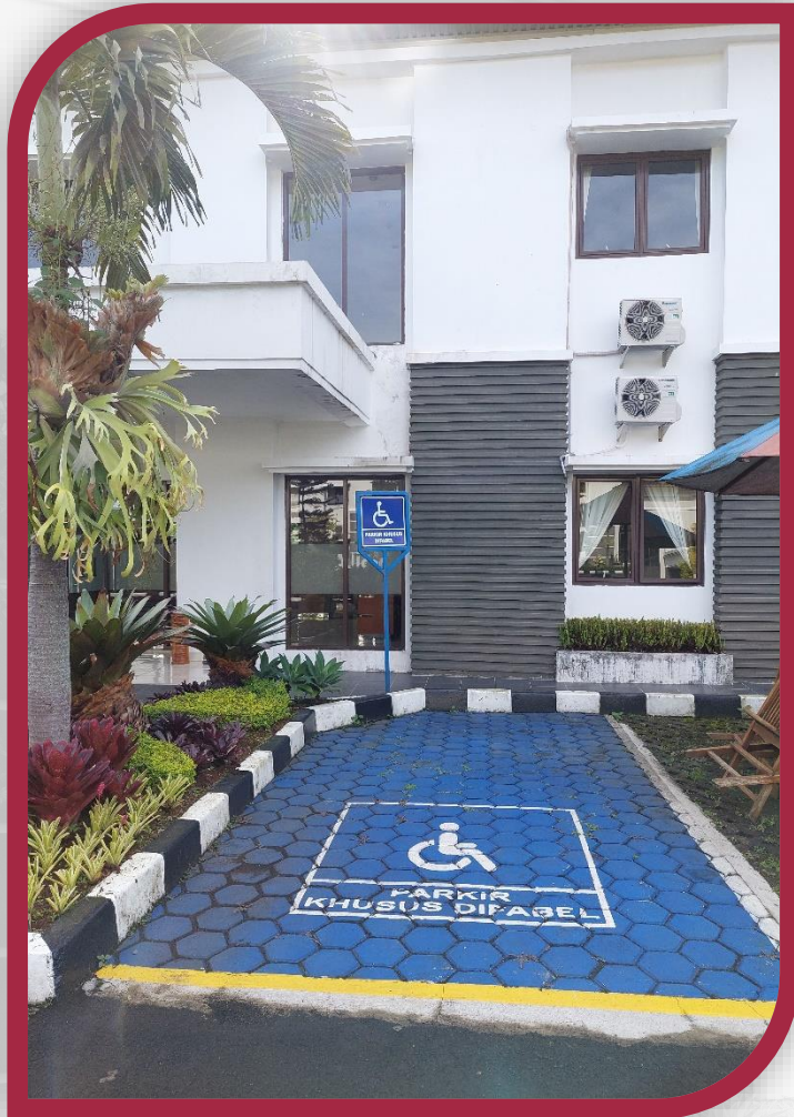
Parkir Khusus Disabilitas di Depan Grha Konstitusi 4