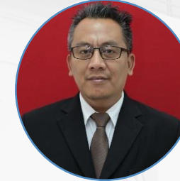
Plt. Kabag Umum