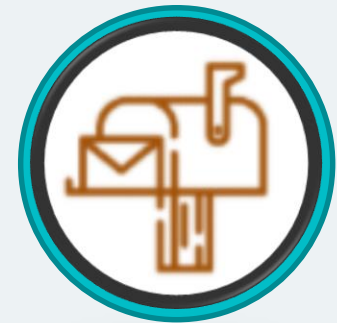
Masukan dan Saran di Microsite